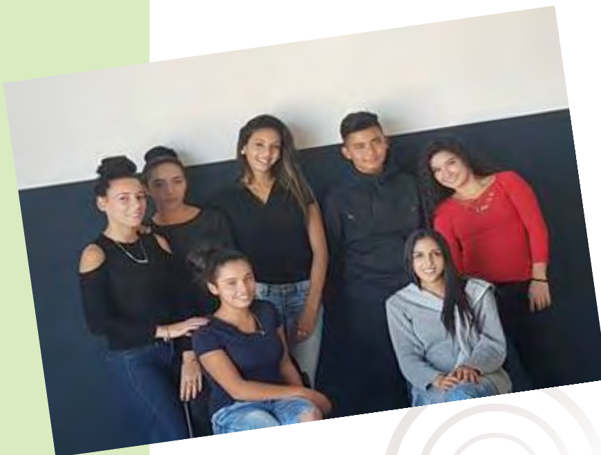
Le collectif des jeunes de l'EAJ du centre social de la Diagonale du Vernet

Les jeunes ont souhaité communiquer sur ces violences. Soutenu par la communauté de communes Perpignan Métropole Méditerranée, le préfet, et les financeurs du centre social dont la Caf, ce film a vocation à être diffusé dans les écoles et les collèges afin de sensibiliser les plus jeunes, pour la plupart usagers des bus de ville, à ces problèmes d'incivilités.